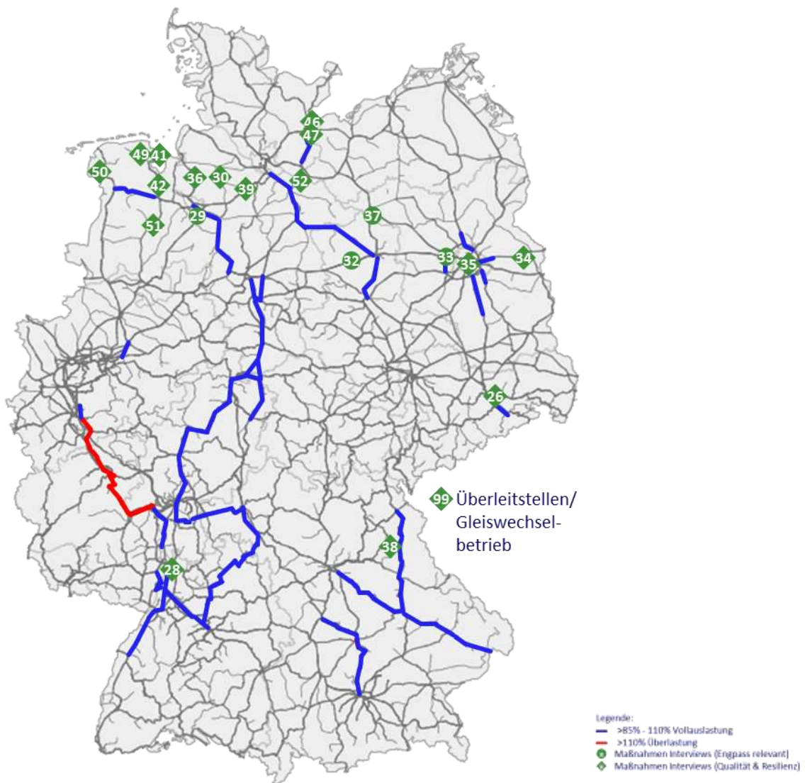
Abb. 2: Güter im Takt-Maßnahmen